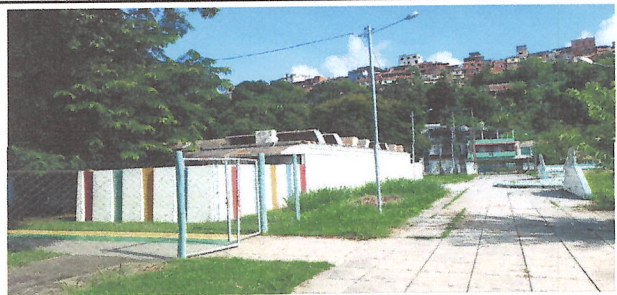
IMAGEM 2: PINTURA EXTERNA GERAL (BLOCO 1) LOCAL: E.M. JOAQUIM RIBEIRO (CAIC)