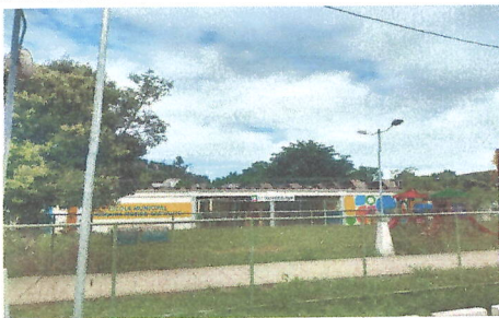
IMAGEM 1: PINTURA EXTERNA GERAL, ALAMBRADO (BLOCO 1) LOCAL: E.M. JOAQUIM RIBEIRO (CAIC)