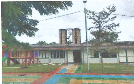
IMAGEM 3: PINTURA EXTERNA, REMOÇÃO DE COMPENSADOS DANIFICADOS (BLOCO 2) LOCAL: E.M. JOAQUIM RIBEIRO (CAIC)