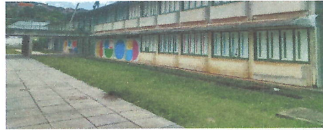
IMAGEM 6: PINTURA EXTERNA E REMOÇÃO DE COMPENSADO (BLOCO 3) LOCAL: E.M. JOAQUIM RIBERO (CAIC)