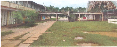
IMAGEM 5: PINTURA EXTERNA (BLOCO 3) LOCAL: E.M. JOAQUIM RIBERO (CAIC)