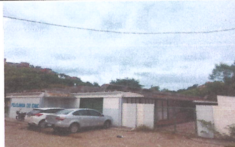
IMAGEM 4: PINTURA EXTERNA (BLOCO 2) LOCAL: E.M. JOAQUIM RIBEIRO (CAIC)