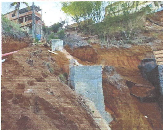
Figura 244-25 - Ensaios de controle de aterro e assentamento de tubos de concreto