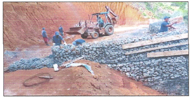
Figuras 9 e 10 - preenchimento das galoas e execução aterro com compactação mecanizada