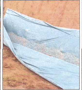
Figuras 1, 2, 3 e 4 - Escavação de aterro com compactação mecanizada, armação das galoas