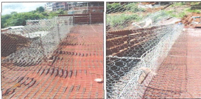
Figuras 16, 17 e 18 - colocação de geotêxtil e armação da gasôla