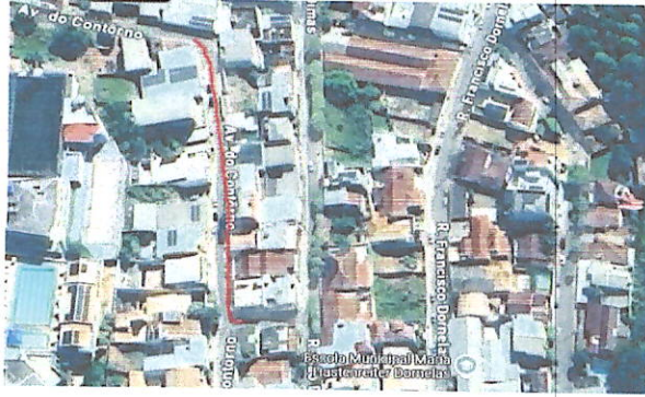
AVENIDA DO CONTORNO_135 A 350, BAIRRO DORNELAS