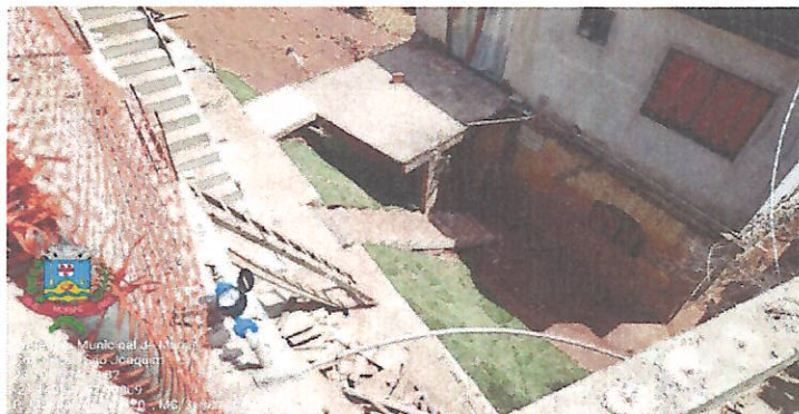
Figura 05 e 06 - Construção de escada em concreto armado e alvenaria lateral; plantio de grama para proteção de talude