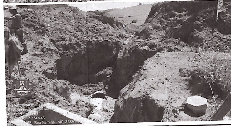
Figura 07 e 08 - Caixa dupla de alvenaria emboçada