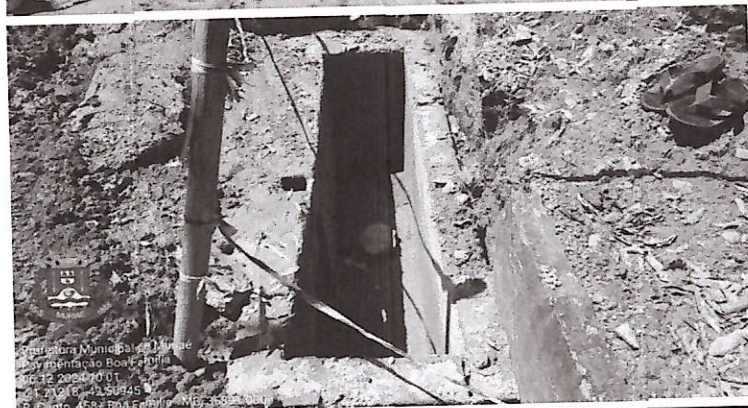
Figura 05 e 06 - Execução de pavimento em blocos de concreto sextavado e caixa dupla de alvenaria emboçada