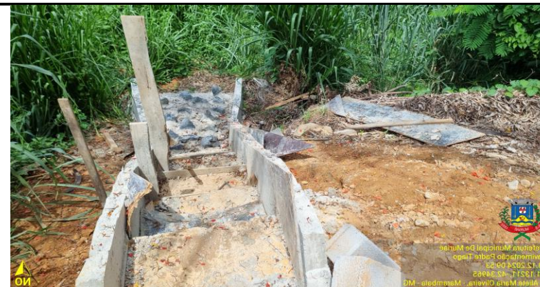
Figura 09 e 10 - Assentamento dos bloquetes sextavados

Prefeitura Municipal De Muriaé Pavimentação Padre Tiago 03.12.2024 09:55 21.132853-42.34983 R. Aliete Maria Oliveira - Marambaia - MG