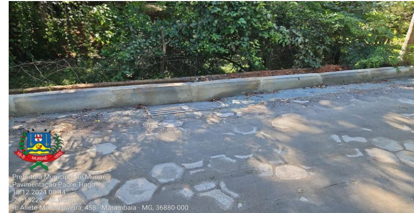
Figura 13 e 14 - Obra finalizada

Prefeitura Municipal de Muriaé Pavimentação Padre Tiago 18.12.2024 08:44 -21.13228 - 42.34967 R. Aliete Maria Oliveira, 458 - Marambaia - MG, 36880-000