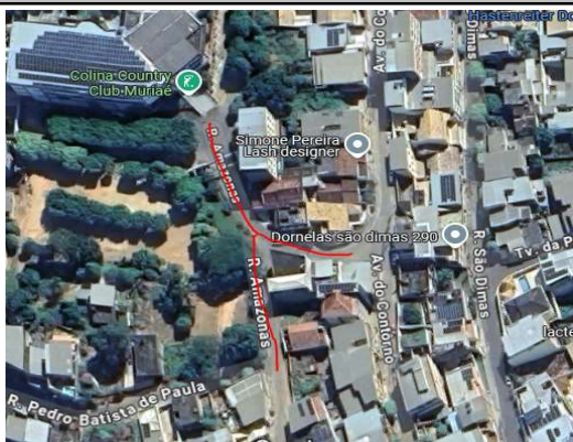
RUA AMAZONAS, BAIRRO DORNELAS