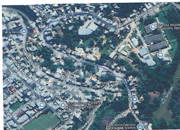
RUA DR. NEWTON RESENDE E RUA ANTÔNIO PEREIRA GALVÃO, BAIRRO ENCOBERTA