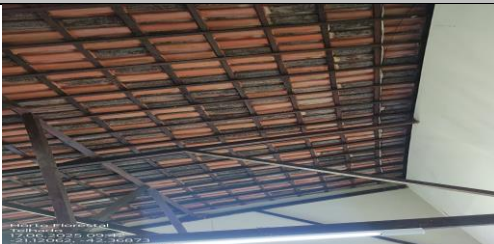
IMAGEM 5: VISTA POR BAIXO DO TELHADO EXISTENTE LOCAL: HORTO FLORESTAL