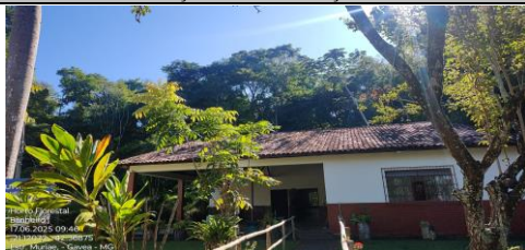
IMAGEM 1: VISTA FRONTAL LOCAL: HORTO FLORESTAL