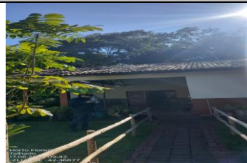
IMAGEM 2: VISTA FRONTAL LOCAL: HORTO FLORESTAL