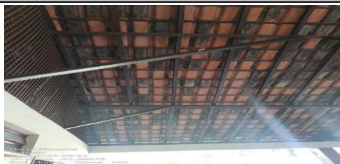
IMAGEM 3: VISTA POR BAIXO DO TELHADO EXISTENTE LOCAL: HORTO FLORESTAL