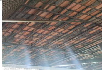
IMAGEM 4: VISTA POR BAIXO DO TELHADO EXISTENTE LOCAL: HORTO FLORESTAL