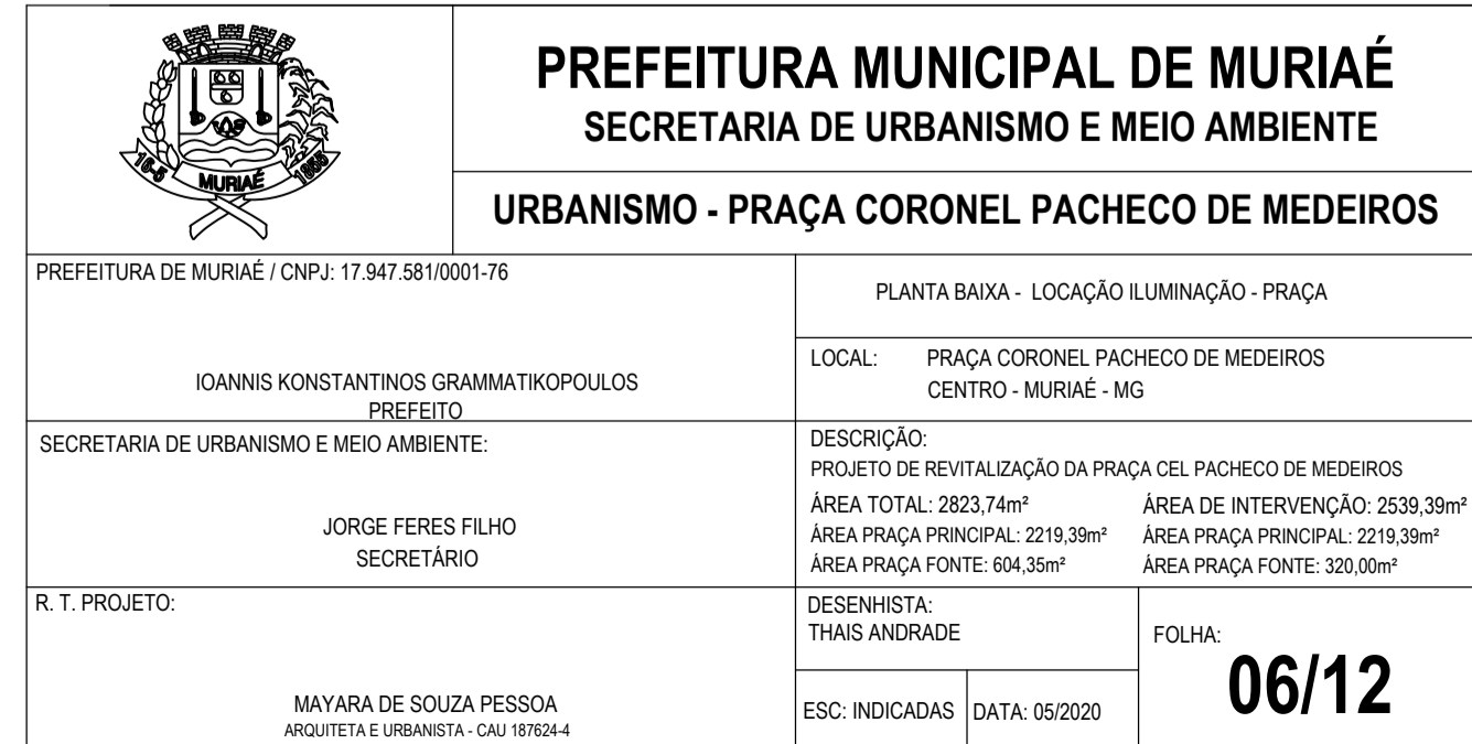
PLANTA BAIXA - LOCAÇÃO DA ILUMINAÇÃO ESC 1:100