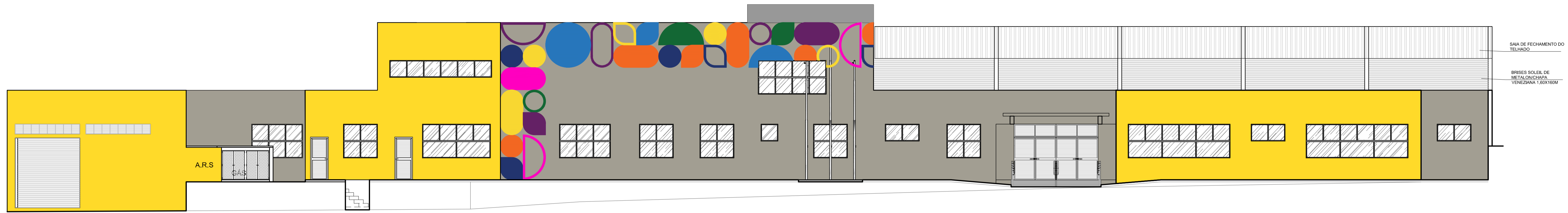
VISTA FRONTAL ESCALA - 1/100