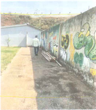
IMAGEM 5: MURO E AREA EXTERNA LOCAL: NOVA MURIAE