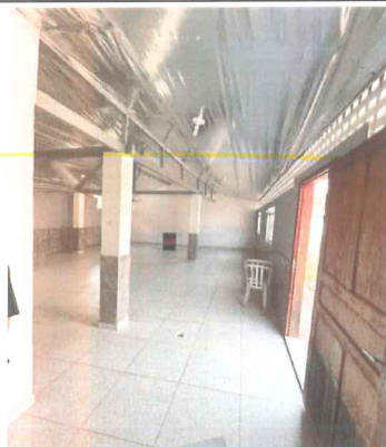
IMAGEM 2: EDIFICAÇÃO 2 LOCAL: NOVA MURIAÉ