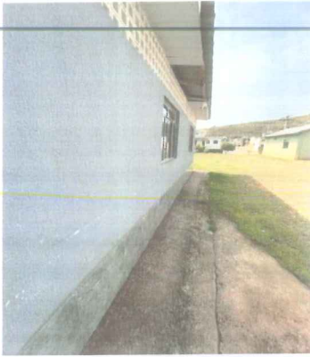
IMAGEM 3: EDIFICACAO 1 LOCAL: NOVA MURIAE