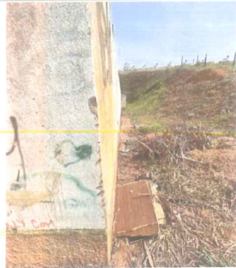
IMAGEM 6: CANALETA A SER EXECUTADA LOCAL: NOVA MURIAE