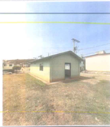
IMAGEM 4: EDIFICACAO 2 LOCAL: NOVA MURIAE