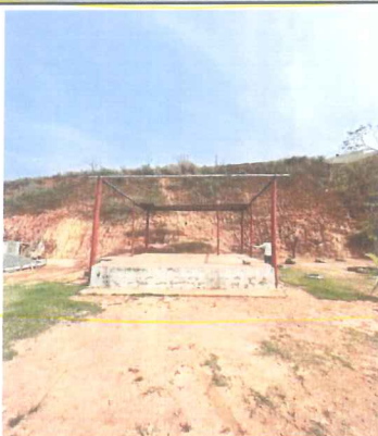
IMAGEM 1: PALCO A SER RECUPERADO LOCAL: NOVA MURIAÉ