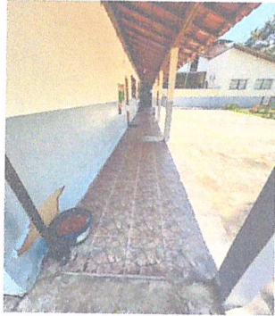
IMAGEM 3: MANUTENCAO E. M. MARIA DO CARMO C. CASTRO LOCAL: PISO A SER TROCADO