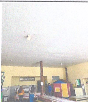
IMAGEM 2: MANUTENÇÃO E. M. MARIA DO CARMO C. CASTRO LOCAL: FORRO

Handwritten signatures and initials in blue ink.