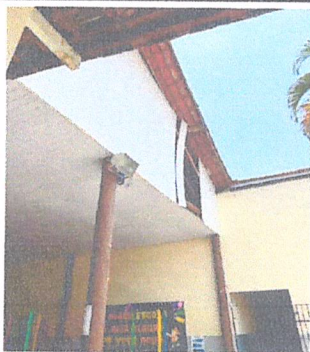
IMAGEM 1: MANUTENÇÃO E. M. MARIA DO CARMO C. CASTRO LOCAL: FORRO - COBERTURA