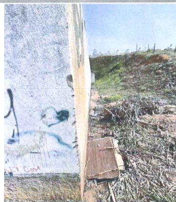
IMAGEM 6: CANALETA A SER EXECUTADA LOCAL: NOVA MURIAE