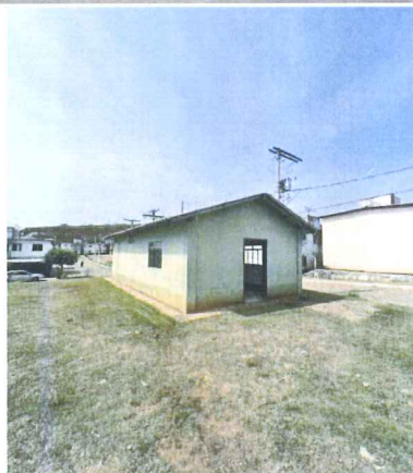
IMAGEM 4: EDIFICACAO 2 LOCAL: NOVA MURIAE