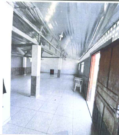
IMAGEM 2: EDIFICACAO 2 LOCAL: NOVA MURIAE