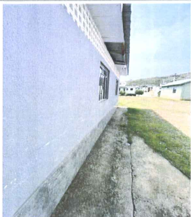
IMAGEM 3: EDIFICACAO 1 LOCAL: NOVA MURIAE