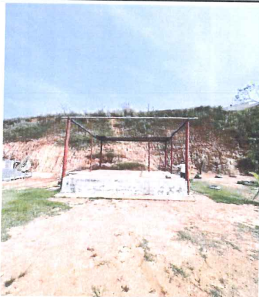
IMAGEM 1: PALCO A SER RECUPERADO LOCAL: NOVA MURIAE