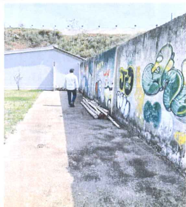
IMAGEM 5: MURO E AREA EXTERNA LOCAL: NOVA MURIAE