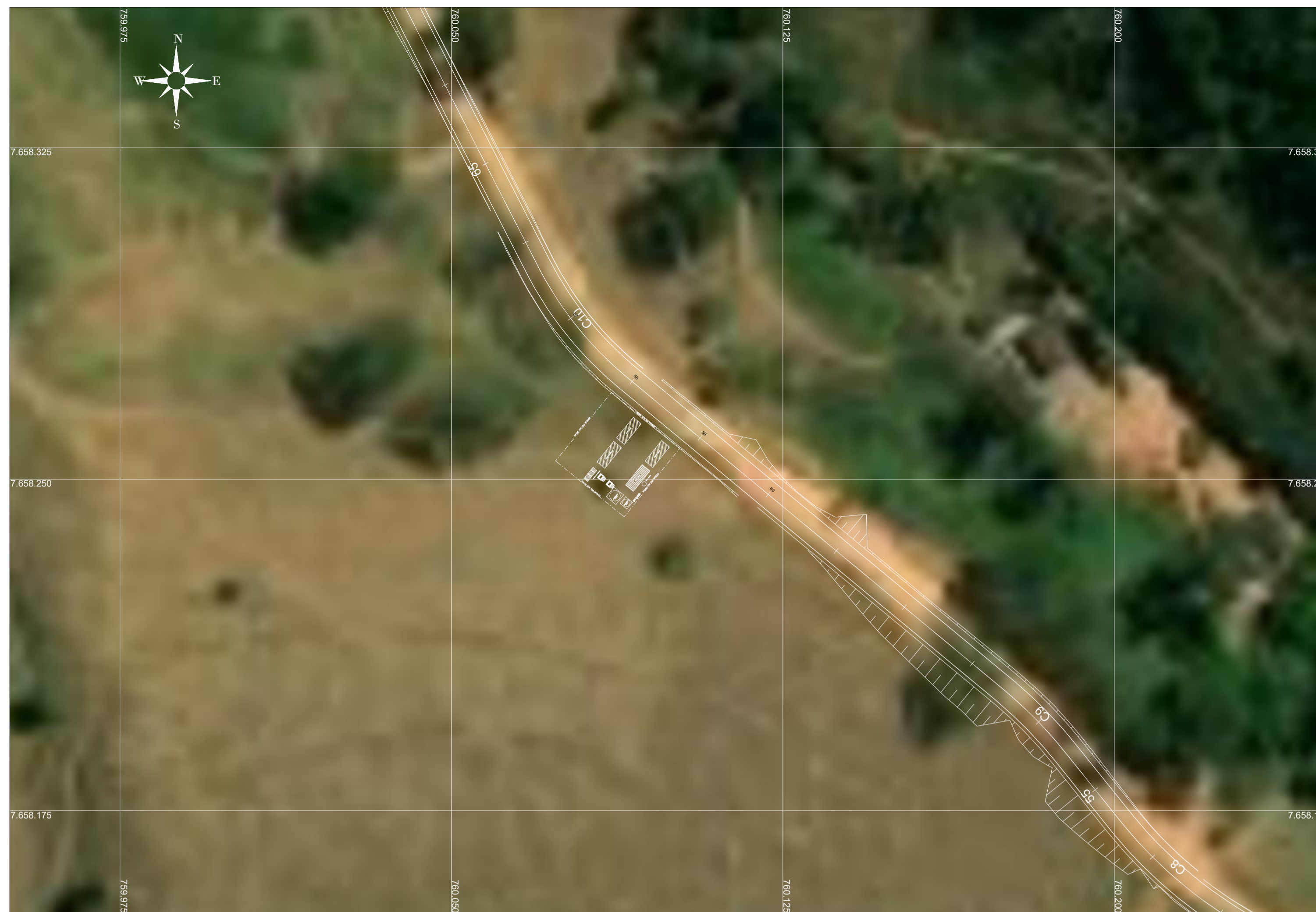
SITUAÇÃO CANTEIRO DE OBRAS ESCALA 1:750