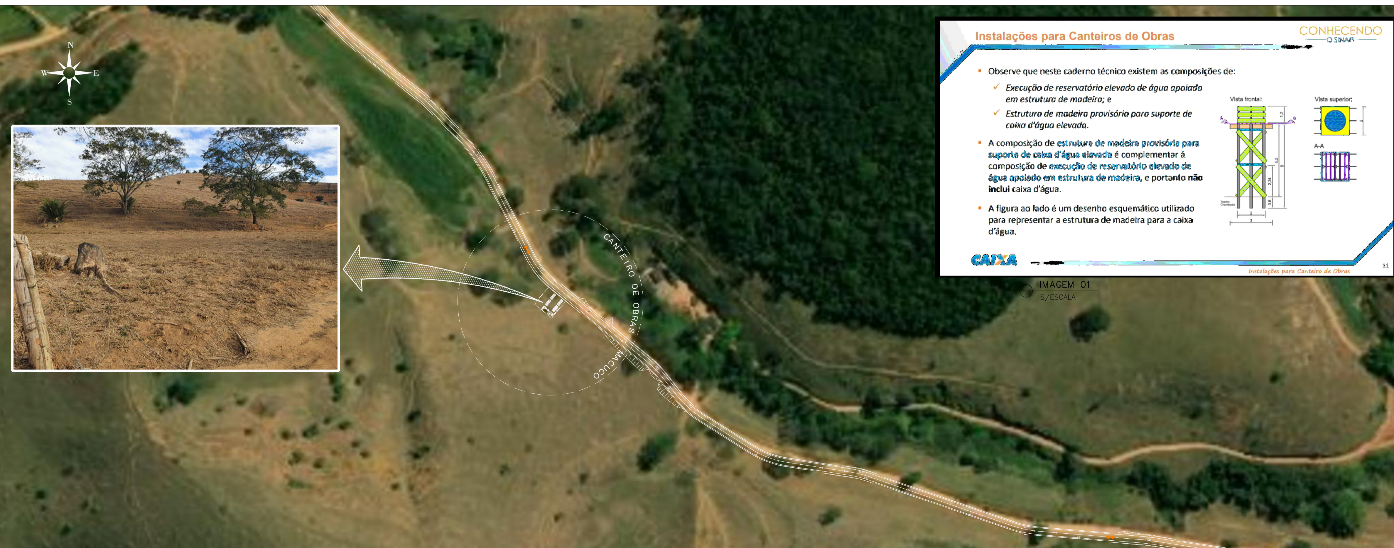
IMPLANTAÇÃO CANTEIRO DE OBRAS ESCALA 1:2000