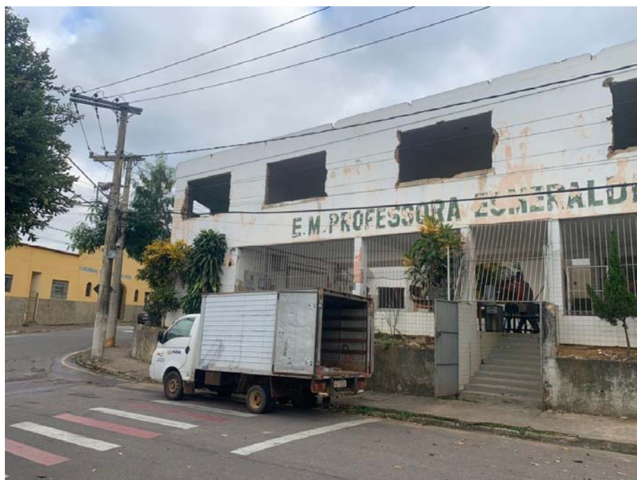
Figura 3: Vista frontal.