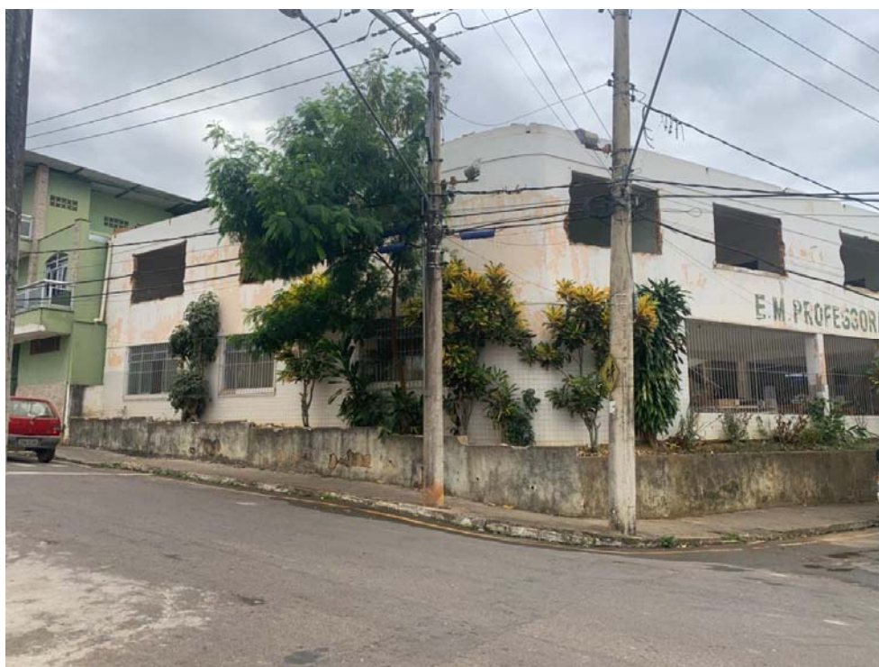
Figura 4: Vista frontal/lado.