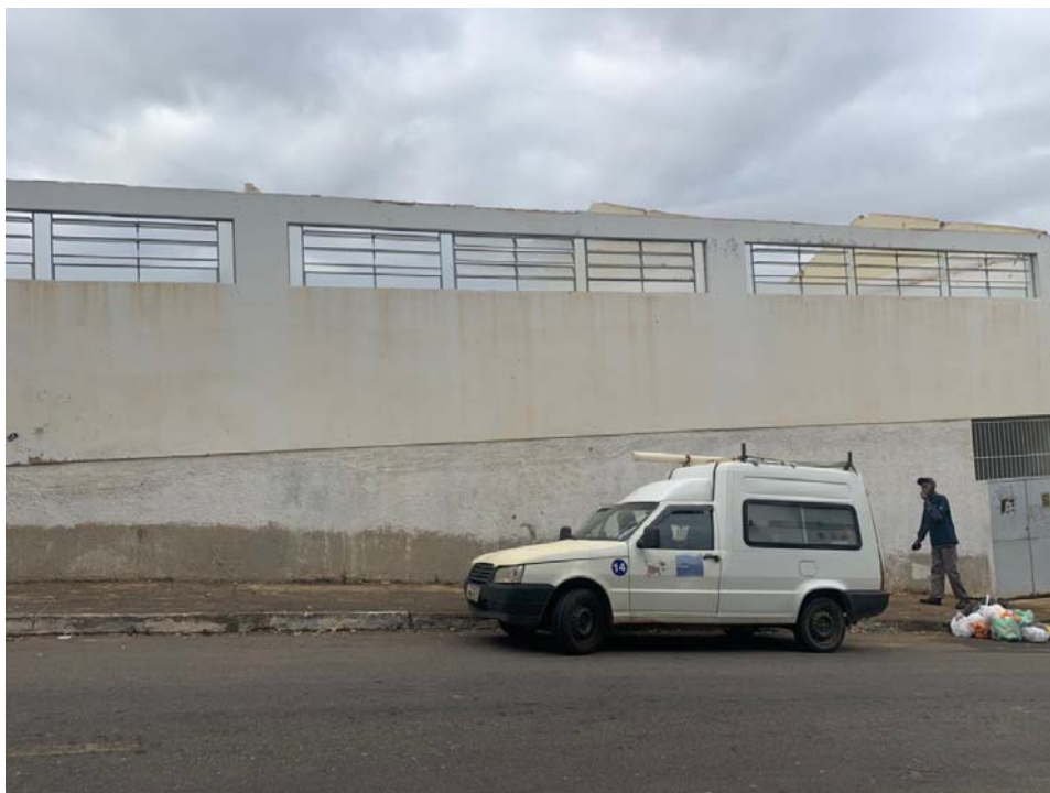
Figura 5: Vista Rua Alvarenga Peixoto