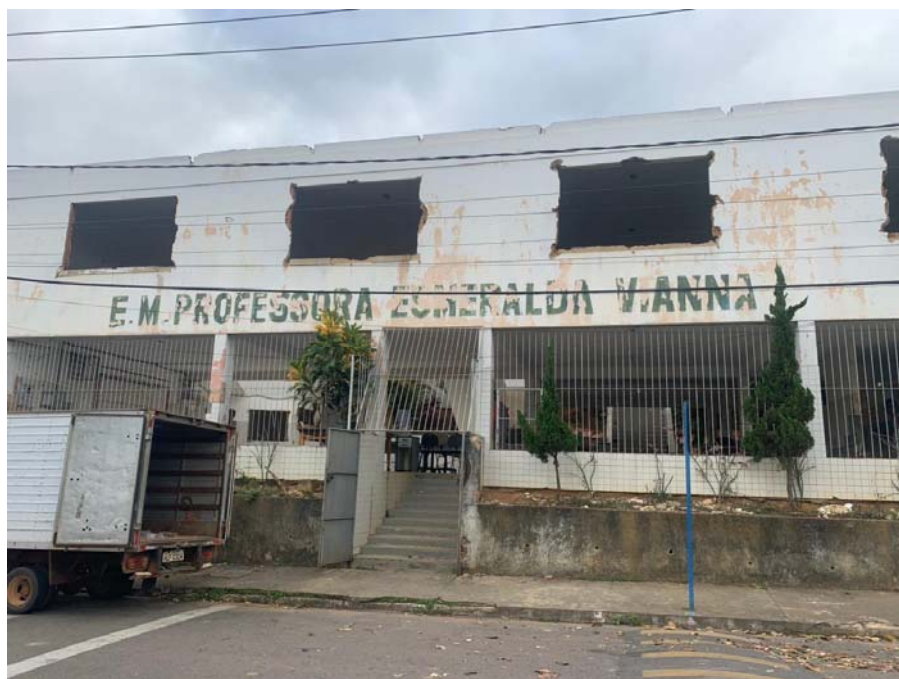
Figura 2: Entrada Principal da escola atualmente.