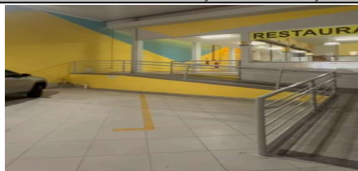
IMAGEM 1: ADEQUAÇÃO RESTAURANTE POPULAR LOCAL: BAIRRO BARRA