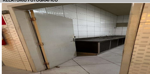
IMAGEM 4: ADEQUAÇÃO RESTAURANTE POPULAR LOCAL: BAIRRO BARRA