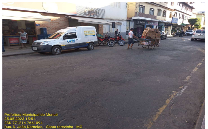
Prefeitura Municipal de Muriaé 25.05.2023 15:51 23K 771214 7661094 Rua, R. João Dornelas, - Santa terezinha - MG