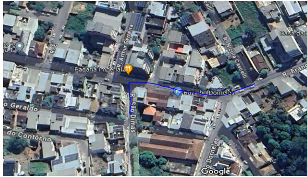
Rua João Dornelas