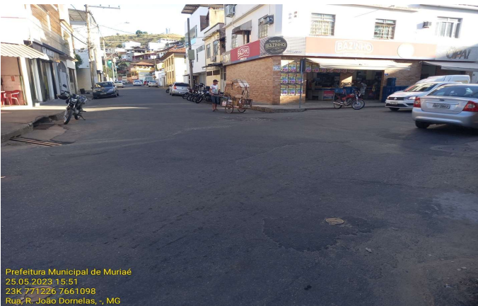
Prefeitura Municipal de Muriaé 25.05.2023 15:51 23K 771226 7661098 Rua, R. João Dornelas, - MG